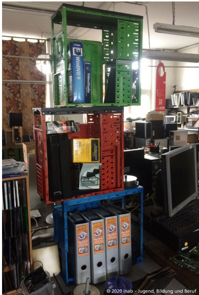
© 2020 inab – Jugend, Bildung und Beruf

Im gesamten Stadtgebiet befinden sich zahlreiche Kooperationspartner*innen mit gemeinsamen Zielen, die eine solidarische, ökologische und interkulturelle Gesellschaft ermöglichen wollen.